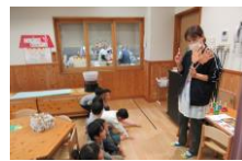
手洗いの仕方もしっかり学びます。