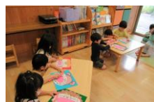
歯みがきのお話をしました。